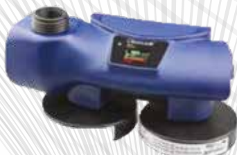
Chemical 2F Ex Atex