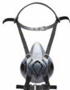
Semi-maschera a raccordo speciale Half-Mask with bayonet connection