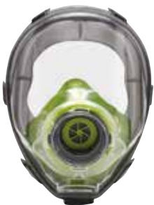
Maschera Panoramica a raccordo speciale Mask with bayonet connection