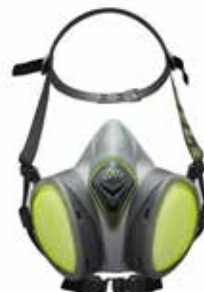
Semi-maschera con filtri integrati Half-Mask with filters integrated