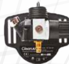
Pressure / FM