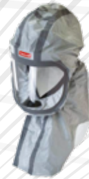
CA10 G tychem F