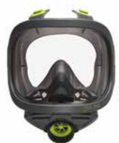
Maschera Panoramica a raccordo unificato Standard thread mask