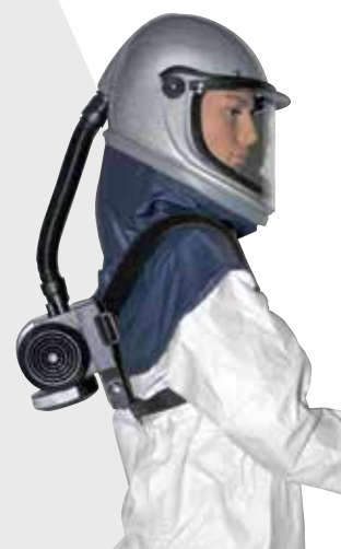
2001U con supporto 0550